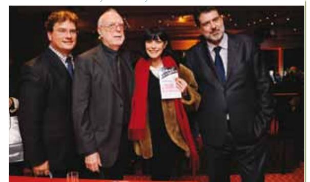
La chanteuse Lio est venue se faire dédicacer le livre de Pascal Lainé