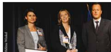
Très justement récompensées pour leur implication et leurs années de travail passées au sein de la MAPPF