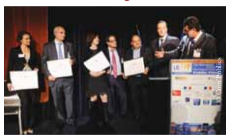
Le consortium vainqueur du projet de CPE de la Région Lorraine (FIDEPPP, Crédit Foncier, Caisse d'Épargne Lorraine et Rabot Dutilleul) pour la rénovation de 4 lycées.