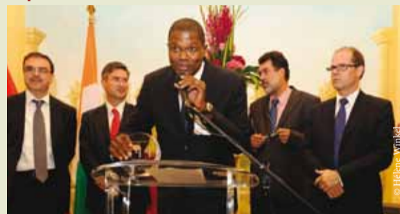
Le Directeur Général de BMCE Capital au Cameroun, a reçu un prix pour son engagement pour les PPP et ses montages financiers innovants pour de grands projets tels que l'aéroport de Dakar.