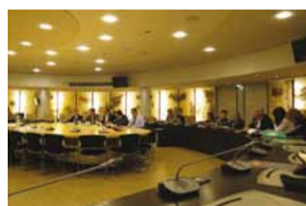
salle des séances au Conseil Général de Seine-Saint-Denis

Le Conseil Général de Seine-Saint-Denis a sollicité le Club des PPP pour une audition dans le cadre de sa mission d'information et d'évaluation sur les PPP, puisque 12 collèges doivent être construits en Contrat de Partenariat et pour un montant de 320 millions d'euros.