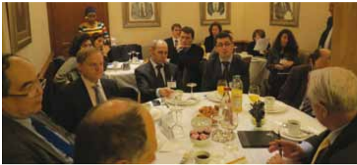
les partenaires du Club sont venus très nombreux pour assister à ce petit-déjeuner spécial «infrastructures routières»