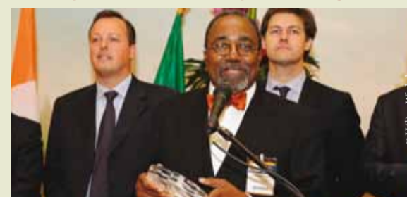
Une première aux LRIPPP, un prix a été remis au Congo pour leur engagement en faveur des PPP.