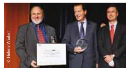
Dominique PERBEN reçoit un prix pour son action au sein de l'Agence l'AFITF qui structure le financement des infrastructures de transports